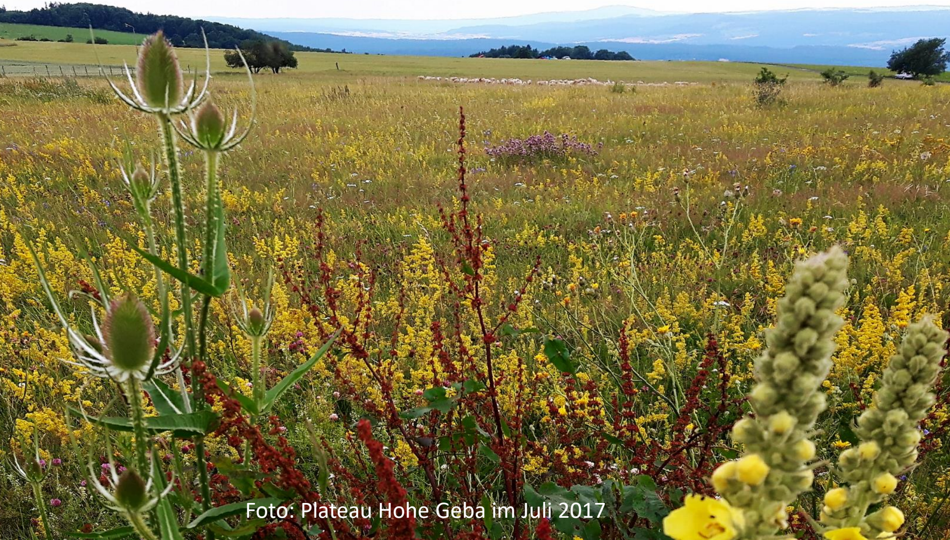
Foto: Plateau Hohe Geba im Juli 2017